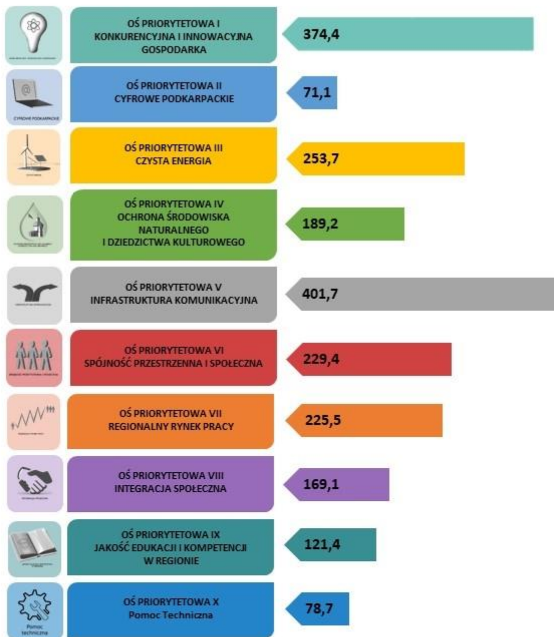
Rysunek 1. Podział alokacji w ramach RPO WP 2014-2020 (alokacja w mln EUR)

W pracach nad RPO WP 2014-2020 wykorzystano szereg wyników badań ewaluacyjnych wynikających z dotychczasowego dorobku ewaluacji z lat 2007-2013. Przede wszystkim w konstruowaniu szczegółowego zakresu interwencji przydatna była Ewaluacja ex-ante Regionalnego Programu Operacyjnego Województwa Podkarpackiego na lata 2014-2020 . W oparciu o wnioski z diagnozy wyzwań, potrzeb i potencjałów regionu ustalono, że realizacja celu głównego będzie wymagała wdrożenia dziesięciu osi priorytetowych.