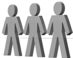
SPÓJNOŚĆ PRZESTRZENNA I SPOŁECZNA

OP VI, przy udziale środków EFRR w wysokości 217 821 373 EUR, realizuje CT 8 (PI 8b), 9 (PI 9a i 9b) i 10 (PI 10a). Wsparcie udzielane jest w ramach trybu konkursowego i pozakonkursowego. W ramach OP VI wspierane są działania dot. zwiększenia dostępności do wysokiej jakości usług publicznych w obszarze zdrowia, pomocy społecznej i edukacji oraz działań rewitalizacyjnych terenów zdegradowanych.