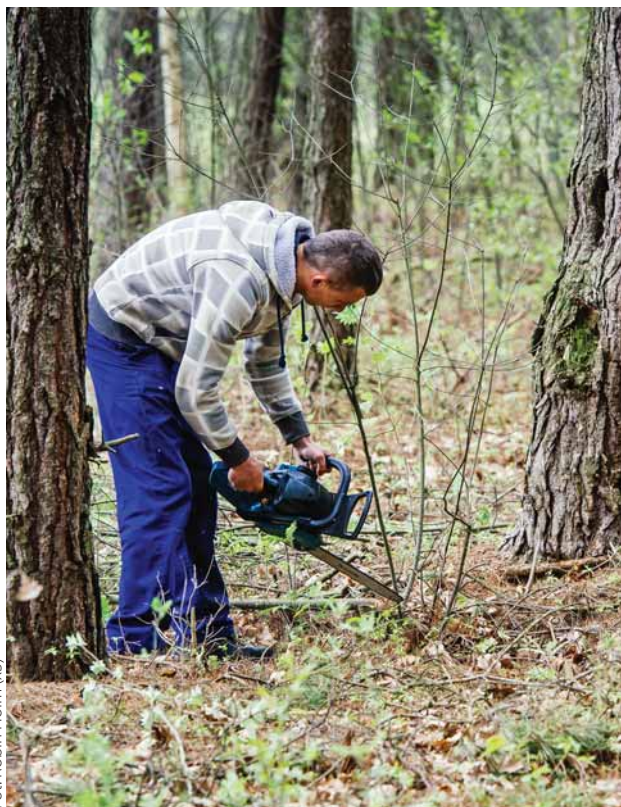
Fot. Robin Holm (x3)